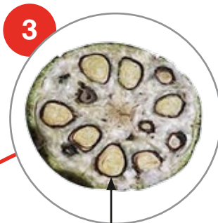
Καρύδι πλήρως ώριμο με περισπέρμιο σκούρο μαύρο. Ψεκασμός για αποφύλλωση επιβεβλημένος.