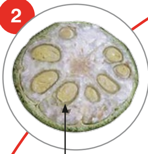
Καρύδι πιο ώριμο, με περισπέρμιο που διακρίνεται σαφώς. Κατάλληλος χρόνος εφαρμογής αν το 70% των καρυδιών είναι σ αυτή την κατάσταση και το 50% έχει ανοίξει.