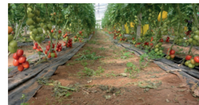
Accudo® - RT1184