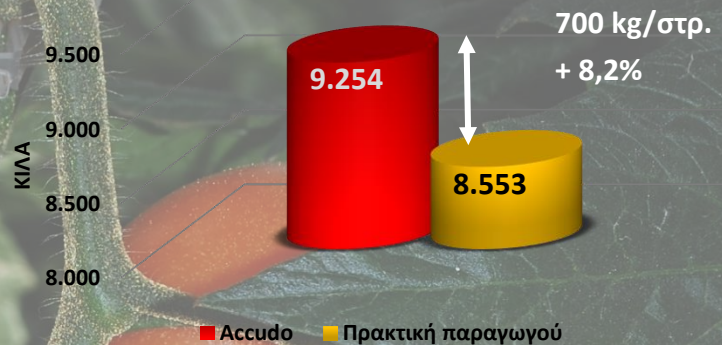
Τελική απόδοση σε καρπούς Α ποιότητας (κιλά)